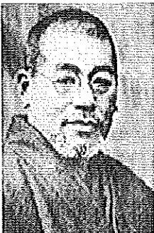
Dr. Mikao Ussui

Reiki é um processo de auto-cura, uma doação contínua de amor e energia, é luz, é prana, é fluido vital e, como dizia Hipócrates, é "força de cura na natureza".